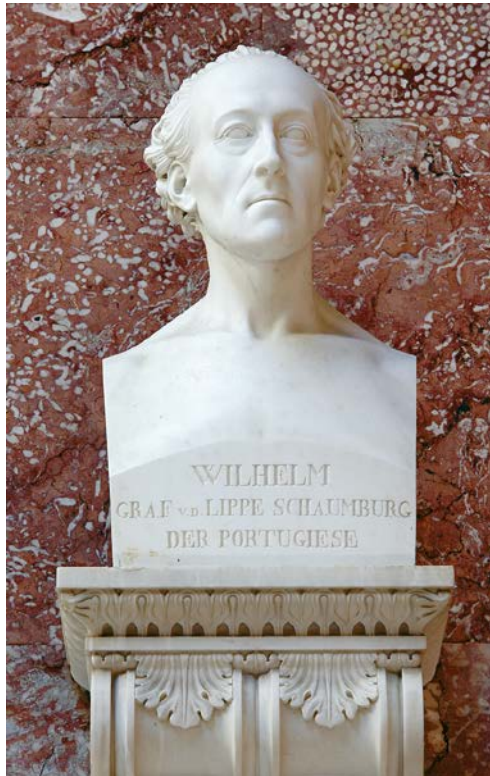
Abb. 2: Shadow-Büste

folgenden Jahr begann der spanische Volksaufstand gegen die Franzosen, im ersten Halbjahr 1809 startete der britische General Arthur Wellesley (der spätere Herzog von Wellington) seinen erfolgreichen Vormarsch in Portugal. 1809 war zudem das Jahr des Tiroler Volksaufstandes und des braunschweigischen sogenannten »Schwarzen Korps«. Der von Graf Wilhelm 1762 befehligte Unabhängigkeitskampf der Portugiesen gegen das mit Frankreich verbündete Spanien wird dabei in Beziehung gesetzt mit dem tagesaktuellen Kampf der Engländer und Spanier gegen die Franzosen. General Gneisenau schrieb sogar: Graf Wilhelms Denkschrift über die Vertheidigung Portugals [...] enthält Zug um Zug auf das genaueste alle Maßregeln, welche später Lord Wellington dort genommen hat, dessen Stellungen und Bewegungen nur die Ausführung von Lippe's Angaben und Vorschriften sind. 26 Graf Wilhelm ist zum Protagonis-