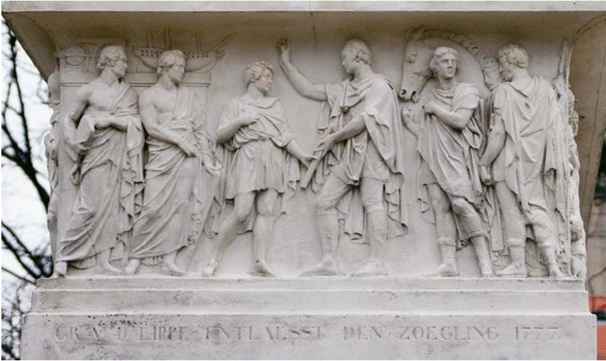
Abb. 3: Graf Wilhelm übergibt Scharnhorst sein Schwert

ten des »Befreiungskampfes« geworden. Sein Denken wird als Voraussetzung der preußischen Militärreformen angesehen.