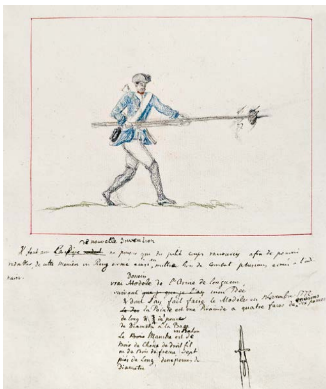
Abb. 1: Eine »neue Erfindung« (nouvelle invention): Skizze des Grafen Wilhelm zu einer neuen Form von Piken. Kennzeichnend für seinen Ansatz in der Kriegskunst blieb die enge Verbindung der Waffengattungen wie der Artillerie und der Infanterie. Aber auch bei letzterer plante der Graf die Verbindung von geschlossener und aufgelöster Formation von Schützen sowie von Pikenieren ein. (NLA BU F 1 A XXXV 18 Nr. 46)

der »kaiserlichen« Armee bestanden zahlreiche Truppenkontingente von Reichsständen und auch Landmilizen innerhalb der Territorien fort: Noch während der französischen Revolutionskriege mobilisierten die südwestdeutschen Territorien ein Zehntel ihrer Bevölkerung. 25 Demgegenüber beinhaltete das im Laufe des 18. Jahrhunderts ausgeformte preußische Kanton-