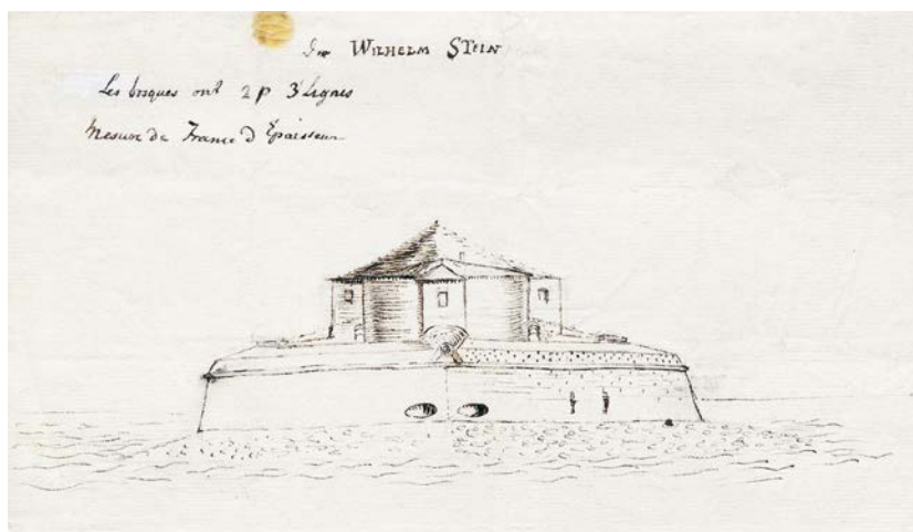
Abb. 3: »Der Wilhelm Stein«: Skizze des Grafen Wilhelm von 1777 für die Festung Wilhelmstein im Steinhuder Meer (NLA BU F 1 XXXV 18 Nr. 48)

knüpfte, 53 beinhaltete dies nicht nur, dass er einen Dauerstreit zwischen Linie und Kolonne löste, sondern auch, dass er sich in die Fußstapfen dieser beiden Klassiker der Militärliteratur stellte. Die Lineartaktik allein hielt er allerdings für überholt: Die breite Gefechtsaufstellung ähnele den Deichen am Meer: Nur eine Schwachstelle genüge, um sie unbrauchbar zu machen. 54 So wie er damit das preußische System der Taktik kritisierte, so lobte er andererseits die dortige exakte Ausführung aller Details nach einheitlichem Muster. 55