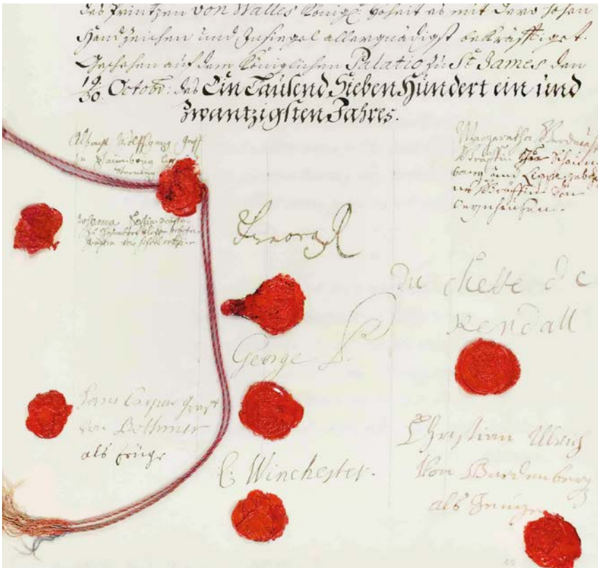
Abb. 2: Unterschriften Ehevertrag (NLA BU F 1 A XIV Nr. 7a Vol. II)

Wohlstandes und Glückes spricht ebenso wie die Erwähnung der Herzogin von Kendal in diesem Dokument für sich. 22 Auch der Ehevertrag verbarg die dynastische Abkunft Margarethes in keiner Weise. Der Ehevertrag wurde