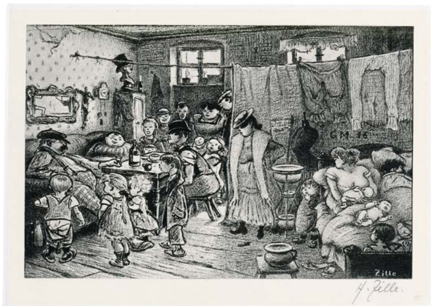
Abb. 3: Heinrich Zille: Geburtstag. Berlin, um 1905