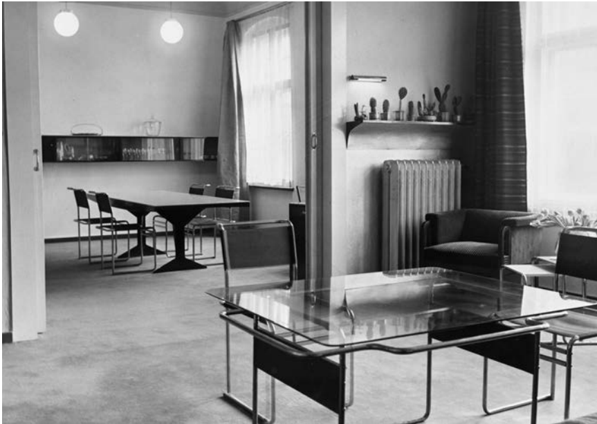
Abb. 1: Marcel Breuer: Inneneinrichtung für Erwin Piscator, 1926–1927, Wohnzimmer