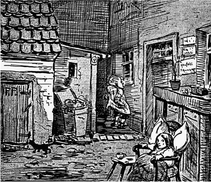
Abb. 4: Heinrich Zille: »Mutta, jib doch die zwee Blumtöpfe raus, Lieschen sitzt so jerne ins Jrüne«, undatiert

losigkeit und der Fähigkeit, die eigenen Bedürfnisse unmittelbar sichtbar zu machen, welche die Pflanzen zu idealen, da erzieherischen ›companions‹ machte. Wie genau die Empfängerinnen und Empfänger der Blumen das Zusammenleben mit diesen einrichteten und ob sie diese halb erzwungene, halb freiwillige Naturkultur als angenehm empfanden, muss fürs Erste dahingestellt bleiben. Heinrich Zille, der bekannte Chronist des Berliner Großstadtlebens, verwies mit der ihm eigenen Komik und Drastik auf das Auseinanderklaffen von Vorstellung und Wirklichkeit, räumte dem bescheidenen Grün im Topf aber immerhin einen wichtigen, wohl auch willkommenen Platz in der Naturkultur des Großstädtlers ein (Abb. 4).