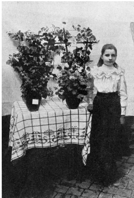
Abb. 3: Besonders gut gezogene Pflanzen von der Ausstellung in Düren nebst einer Pflegerin