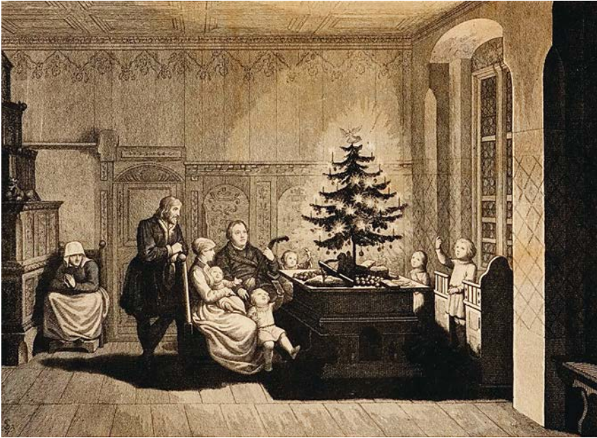
Abb. 1: Carl August Schwerdgeburth: Siehe: ich verkündige euch große Freude, Stahlstich, 1843

1843 veröffentlichtem »Weihnachtsbüchlein« bildet (Abb. 1), suggeriert eine ähnliche Genealogie. 29