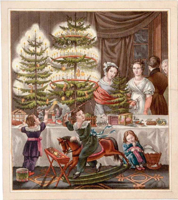
Abb. 2: Ludwig Meyer: Weihnachten ist da , kolorierter Stich, 1824

Zwar erinnern diese Garten-Tisch-Arrangements mit Tanne(n) auf den ersten Blick vor allem an barocke Kunstkammern oder Münz- beziehungsweise Antiken-Kabinette, die auf hüfthohen Tischen drapiert wurden, um die Betrachtung und das Studium der Objekte zu ermöglichen. Sie stehen aber vielmehr den Pflanzentischen und -kabinetten nahe, die laut Sophie Ruppel das Zeitalter der aufklärerischen Botanophilie kennzeichnen. 54 Wie Ruppel umfangreich dargelegt hat, war das Ziel der bür-