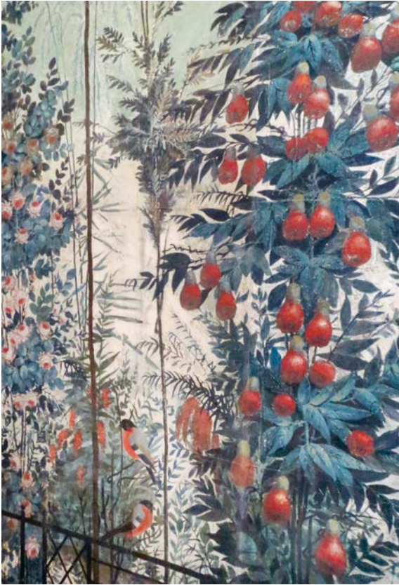
Abb. 6: Schloss Paretz, Gartensaal, Detail, 2023

Granatäpfel ein gängiges Motiv, ebenso wie große Blütenzweige mit Vögeln und Insekten, Kirsch-, Pflaumen- oder Litschibäume, Bambus, Oleander und Teesträucher oder Blumen wie Chrysanthemen, Hibiskus, Hortensien und Wasserlilien. 50 Diese Tapeten wurden nicht nur wegen ihrer Ästhetik, sondern auch wegen ihrer naturgetreuen Darstellung geschätzt, welche die Begegnung mit außereuropäischen Pflanzen ermöglichte. Ästhetische und naturkundliche Vermittlung, Ikonografie und