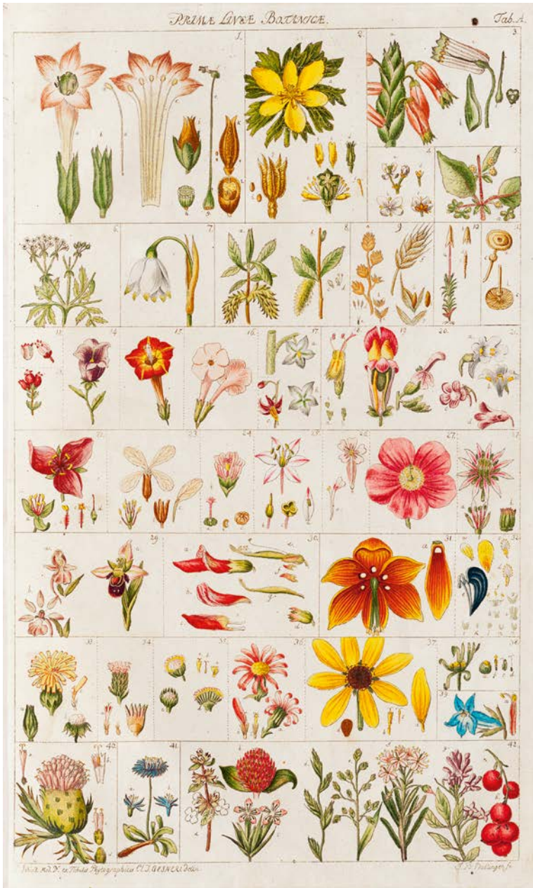
Abb. 7: Salomon Schinz, Blatt aus »Stubentapeten für die Jugend«, Anhang zur Anleitung zu der Pflanzenkenntniß, Zentralbibliothek Zürich, Signatur: NB 25: a F