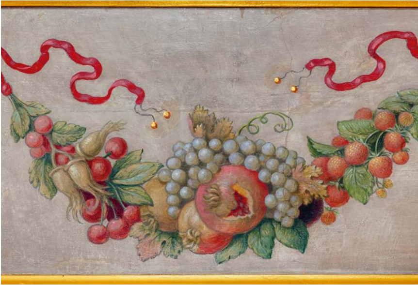
Abb. 5: Wandmalerei, Girlande mit Granatäpfeln, Wörlitz, Villa Hamilton

schlägt ein Epigramm Abraham Gotthelf Kästners an, das die erfolgreiche Befruchtung einer Zwergdattelpalme zum Thema hat und dieses als »Experimentum berolinense« in die Wissenschaftsgeschichte 46 eingegangene Ereignis als Erfolg des preußischen Monarchen verbucht beziehungsweise mit der Geschichte Brandenburgs assoziiert: