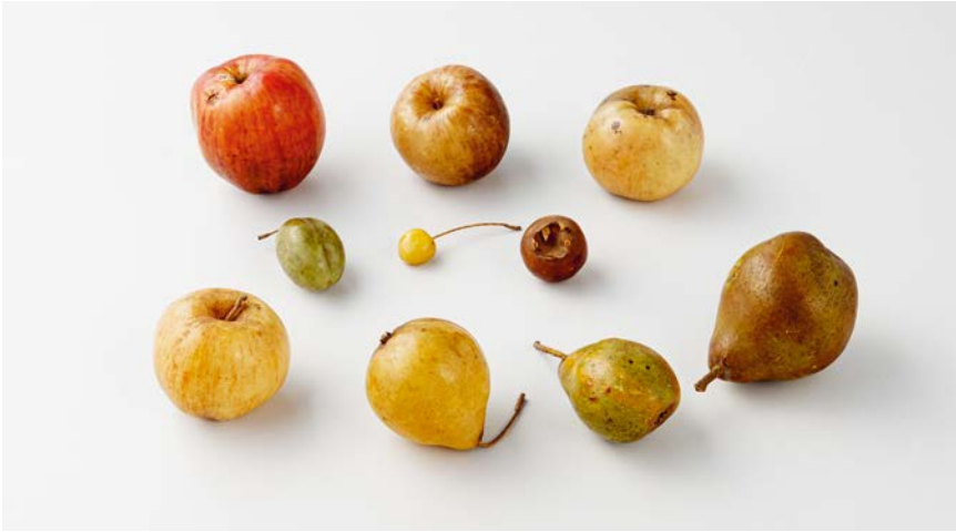
Abb. 4: Wachsfrüchte aus dem Pomologischen Kabinett von Fürst Leopold III. Friedrich Franz