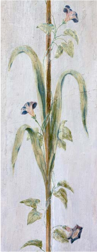
Abb. 3: Wandmalerei Trichterwinde und Schilf, Luisium, Dessau

Im Zusammenleben und Wohnen mit Pflanzen scheint die zeitgenössische Diskussion um die Gefühle von Pflanzen, deren sexuelles und erotisches Empfindungsleben Spuren hinterlassen zu haben. Linnés Klassifikationssystem baut auf der Annahme einer Sexualität der Pflanzen auf. In den Präludien seiner Schrift Sponsalia Plantarum (»Die Hochzeit der Pflanzen«) von 1746 stellt Linné fest: »Ja selbst die Pflanzen ergreift die Liebe.« 35 Sein auch in einer Zeichnung überliefertes Amor unit Plantas dokumentiert die Auffassung, dass Pflanzen einen Begriff und eine Empfindung von der Liebeslust haben und ihnen ein Begehren innewohnt. 36 Wenngleich eine direkte Rezeption nur schwer nachweisbar ist, so scheinen Linnés Auffassungen im Interieur des späten 18. Jahrhunderts, wo die Pflanze gern als