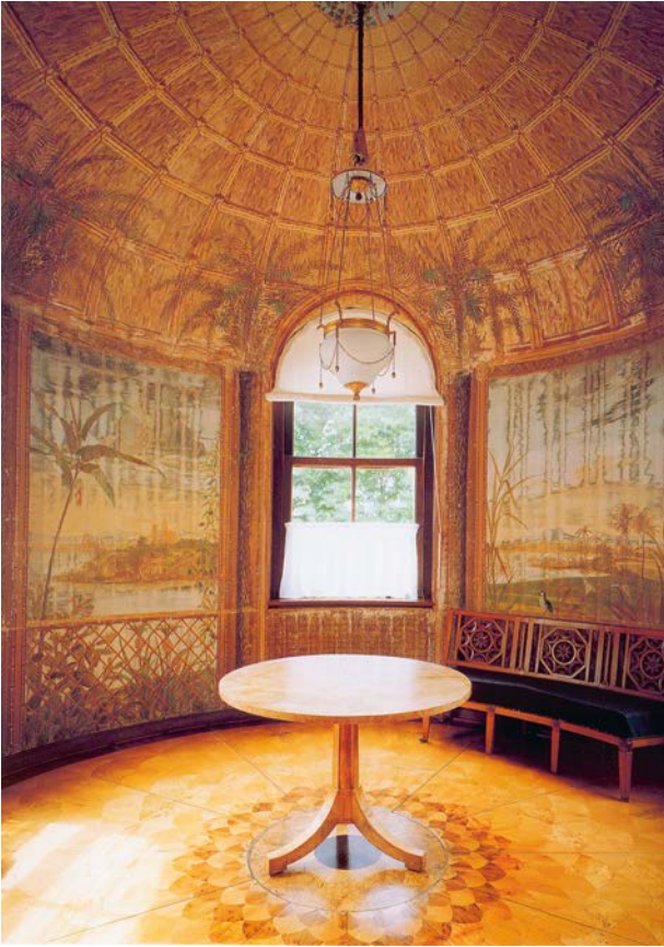
Abb. 8: Otaheitisches Kabinett auf der Pfaueninsel

kinder« plädiert er dafür, dass man anhand seiner farbigen Tafeln nun auch in Gärten »eine Garten-Partie mit einem dazu gehörigen Gebäude, oder auch in einer Wohnung ein Zimmer, im O-Tahitischen Geschmack einrichten« könne. 63 Als farbige Beispieltafel für eine entsprechende Innenausmalung diente ein Ausblick aus einer Holzhütte, auf der ein Brustschmuck eines Kriegers, Waffen, Werkzeuge und Musikinstrumente zu erkennen sind.