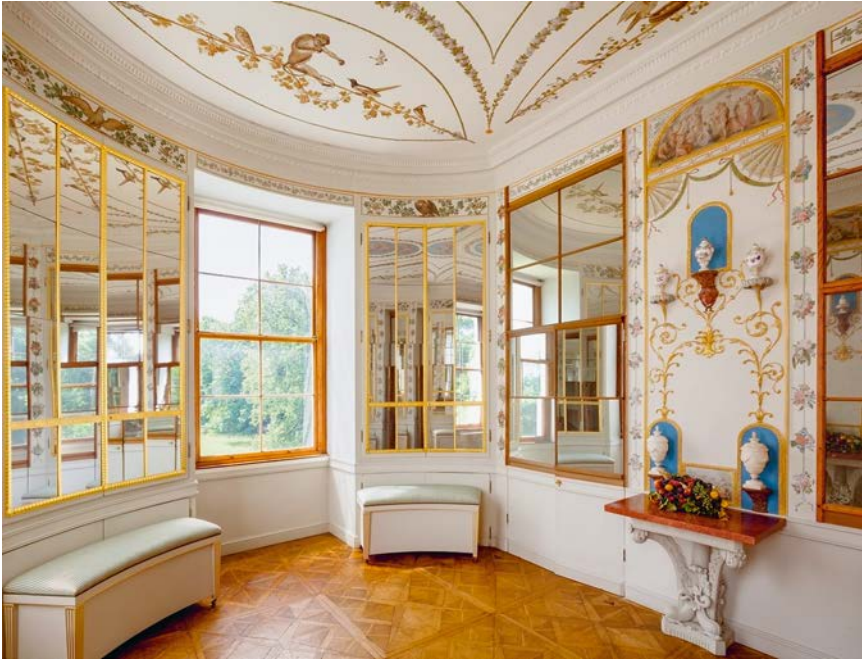
Abb. 2: Spiegelkabinett im Luisium, Dessau

bannt«. 31 Vegetabile und zugleich vitalistische Formen beherrschten die Ikonografie der Zeit, die nicht zuletzt von literarischen Texten beeinflusst zu sein scheint. So findet sich in dem vom passionierten Botaniker Jean-Jacques Rousseau verfassten epochemachenden Briefroman Julie, oder die neue Heloise eine Passage, in der ein »Baumgarten« besichtigt wird, der nur aus »einheimischen« Pflanzen besteht. In ihm herrschen eine Wildheit und Dynamik, die durch Begriffe wie Ranken, Schlingen, Wachsen oder »Guirlanden« noch verstärkt werden: