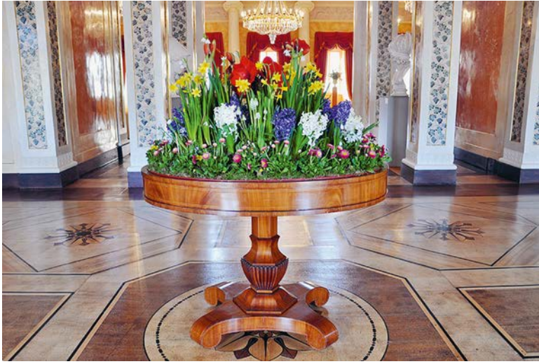
Abb. 5: Blumentisch aus dem Besitz der Großherzogin Maria Pawlowna

der Funktionalität, sondern auch des sozialen Status und des Modegeschmacks: »Für elegante Wohnräume freilich empfehlen sich nur aus besseren Holzarten gefertigte und stylvoll gehaltene Blumentische, welche nach Styl und Farbe den übrigen Mobilien entsprechen.« 23