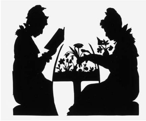
Abb. 6: Mutter und Tochter am Blumentisch, Scherenschnitt, um 1820, Deutsches Literaturarchiv Marbach

häuslichen Raum. Andererseits fungiert es zugleich als Modell, das reale weibliche Präsenz überflüssig macht, da es selbst die gärtnerische Tätigkeit übernimmt.