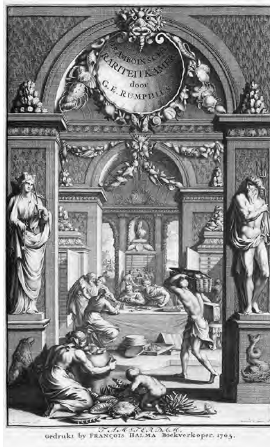
Abb. 4 Frontispiz zu Georg Eberhard Rumpf, D'Amboinsche Rariteitkamer, Amsterdam 1705

die Bilder Arcimboldos, die Gründer über den Umweg des Kataloges der Gottorfer Kunstkammer rezipiert haben könnte. Entscheidender war jedoch sicher das Frontispiz zu Georg Eberhard Rumpfs D'Amboinsche Rariteitkamer (1705), auf die er sich im Inventar wiederholt bezieht (siehe Abb. 3 und 4). 5 In der Kombination dieser Gestaltungsmittel entsteht ein Spiel aus anthropomorpher Verlebendigung und Objekthaftigkeit, Einheitlichkeit und Varianz. Auf diese Weise wird Gründlers Bildprogramm zu einem Instrument der Gliederung der Sammlungsordnung, das zugleich deren Memorierbarkeit erleichtert.