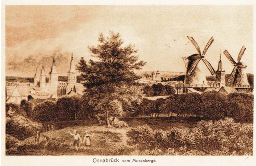
Osnabrück vom Musenberge.

Abb. 1: »Osnabrück vom Musenberge«, Postkarte, nach 1908 (9,1 x 14,1 cm)