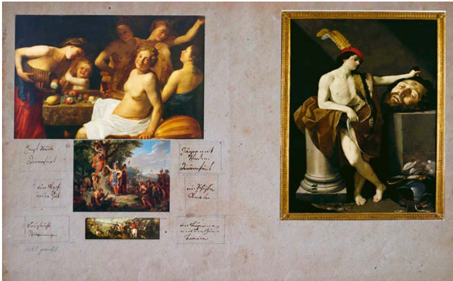
Abb. 4: Gemäldesammlung der Familie Stüve in der Krahnstr. 25, Hängungsplan (Ausschnitt), 1816

schöngestig und trotz des Vormärz unpolitisch. Das riss den agilen und die Institution »Verein« als politisches Instrument begreifenden Johann Carl Bertram Stüve zu der folgenden bissigen Bemerkung hin: