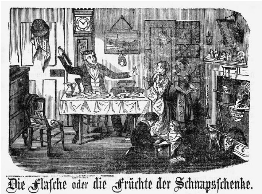
Abb. 5: »Die Flasche oder die Früchte der Schnapsschenke. Eine Erzählung in acht Bildern«; F. Naumann, Hannover o.J.

terpretierte den spontanen Erfolg des Vereins als ein merkwürdiges Beispiel, wie die Selbständigkeit der Gesinnung, die aus unserm Kampfe folgt, nach andern Seiten wirkt. 75 Es herrschte demnach eine gesellschaftspolitische Aufbruchstimmung, die sich in konkrete Politik umformen ließ. Das Medium dafür war der Verein. Hinzu kam hier sicher auch, dass mit den Kirchen zentrale gesellschaftliche Akteure beteiligt waren. Die traditionelle Form der Predigt bekam nun mit dem Verein eine neue moderne Methode der Vermittlung an die Seite gestellt.