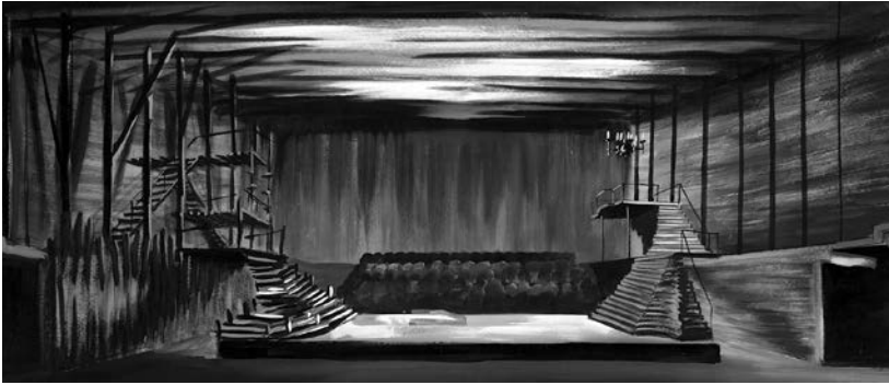
Abbildung 3: Bühnenbildentwurf zu Friedrich Schiller »Die Räuber«, Nationaltheater Mannheim, Kleines Haus 1957, Regie: Erwin Piscator, Bühnenbild: Paul Walter (TWS Köln)

Man muß es Piscator hoch anrechnen, daß er sich hier, ganz gegen seine frühere Art, zum dienenden Interpreten des Dichters machte, und zwar des ganzen Schiller, daß er also nicht die gemilderte ›Mannheimer Theater-Ausgabe‹ zugrunde legte. Wenn auch die manchmal reichlich drastischen Ausdrücke des blutjungen Kraftgenies grell in den Ohren klangen, so blieb doch der Eindruck eines von hohem Ethos getragenen Idealismus, blieb auch die ›moralische Anstalt‹, das Empfinden einer auch heute noch unverminderten Aktualität des Stoffes. 37