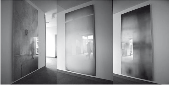
Abb. 3: Alison Dalwood: Time Visible as Moving Light , von links nach rechts: Wallpaper, Striplight, Tiles , 2007, University of Ulster. Fotografien unter milchigem Perspex, jeweils 280 x 150 cm.