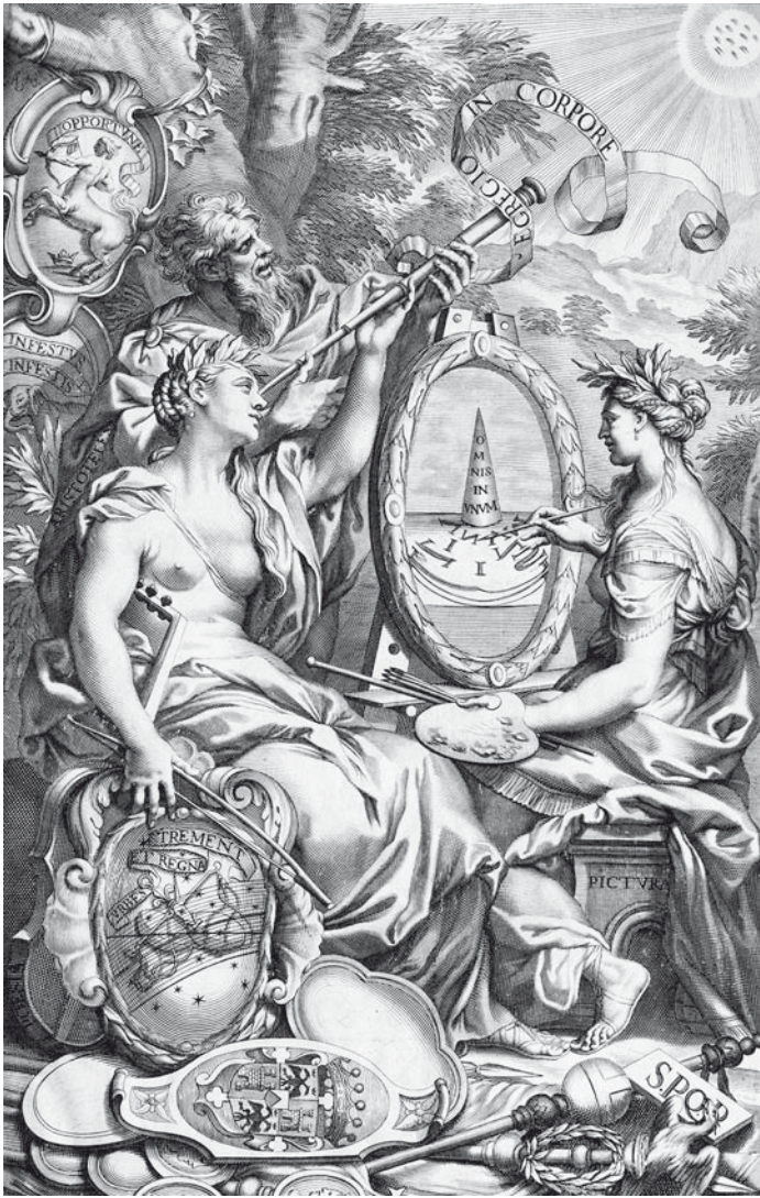
Abb. 4: Frontispiz aus Emanuele Tesauro's Il Cannocchiale Aristotelico (1670).